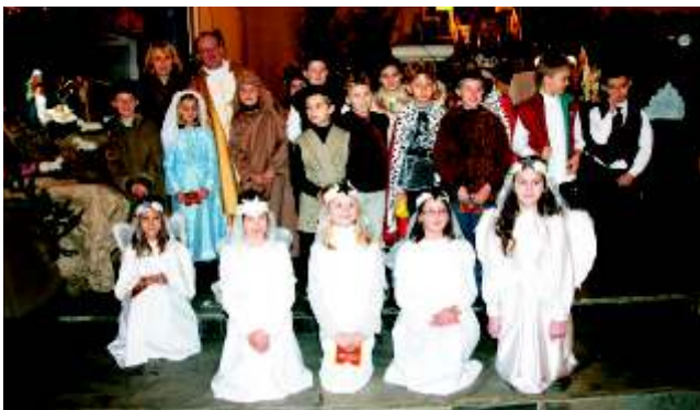
Jasełka w Gierałtowicach