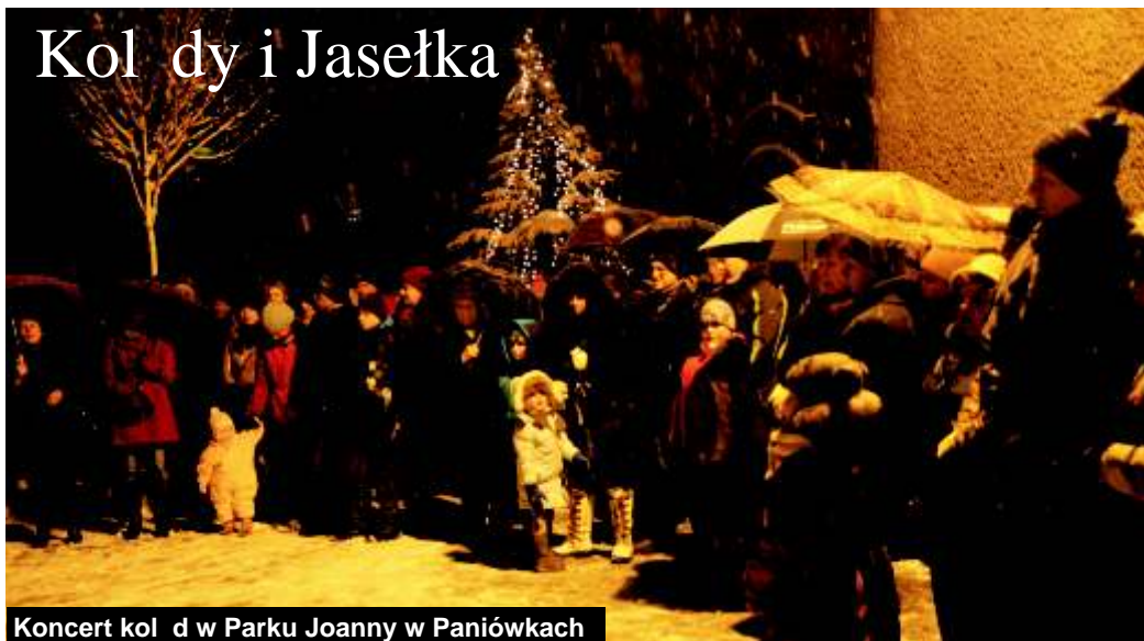
Koncert kol d w Parku Joanny w Paniówkach