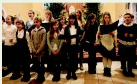
Kol dy i Jasełka