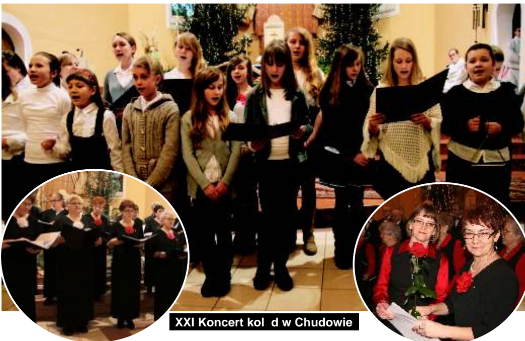
XXI Koncert kol d w Chudowie