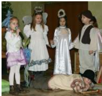
Jasełka w Przyszowicach