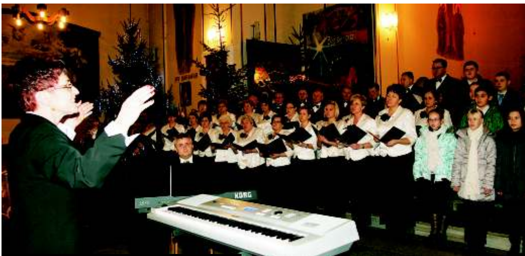
Wspólne kol dowanie w Gierałtowicach