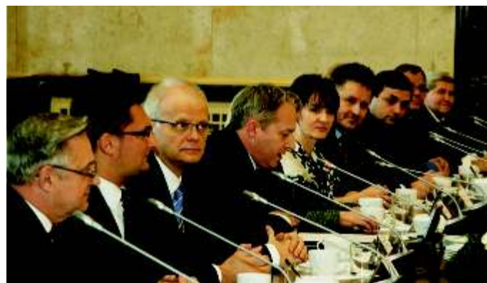
Uczestnicy spotkania z prezydentem RP

Samorządowcy wskazali na zagrożenia dla gmin wynikające z konieczności zwrotu kwot podatków należnych gminom od wyrobisk górniczych oraz konieczności wygenerowania nowych miejsc pracy w procesie restru-