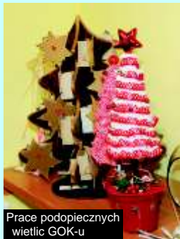
Prace podopiecznych wietlic GOK-u