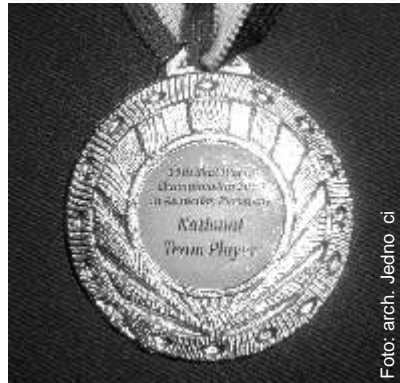
Srebrny medal za drużynowe wicemistrzostwo wiaty

Polska. Medal zdobyty tam przez naszą reprezentację jest już czwartym srebrem wywalczonym przez Polaków