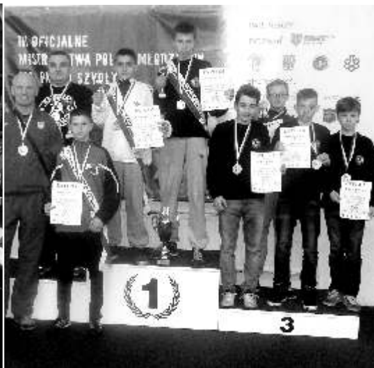
Nasi brzoze medaliści na 3 stopniu podium