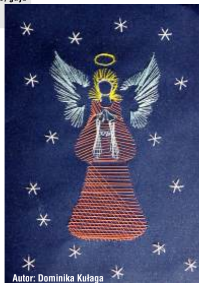
Autor: Dominika Kułaga