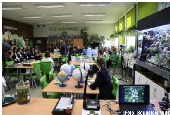
O takiej pracowni jak Zielona Sfera rodzice dzisiejszych uczniów mogli jedynie pomarzyć...

Nowe i funkcjonalne meble, sprzęt multimedialny, pomoce dydaktyczne - wszystko pachnące świeżością i na miarę XXI wieku. Wiwarium, miniszklarnie, mikroskopy, globusy, mapy, modele komórek, plansze interaktywne, programy, wizualizer, aparat fotograficzny, a nawet... miernik zanieczyszczenia powietrza. Do tego kącik