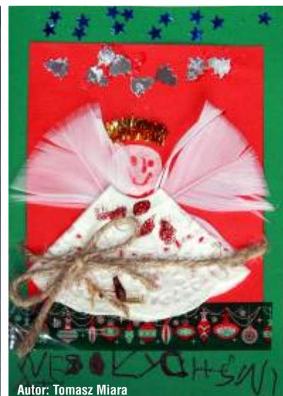
Autor: Tomasz Miara