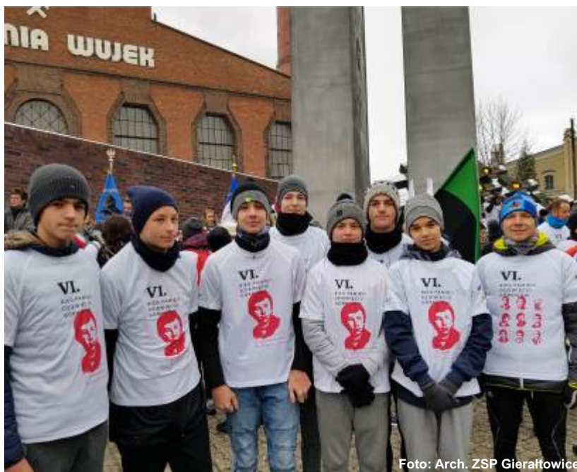
Uczniowie z Gierałtowiec uczestniczyli we wspólniej lekcji współczesnej historii Śląska i Polski.

Postawa górników dowodzi, iż stanęli w obronie najważniejszych wartości - prawa do wolności i godności. Nie zawahali się nawet, gdy przyszło im wystąpić przeciwko czołgom i uzbrojonym oddziałom ZOMO. To właśnie ich działaniu, ich bohaterstwu zawdzięczamy drogę dla wolności - mówił