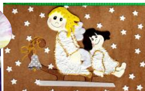
Autor: Emilia Kisiel