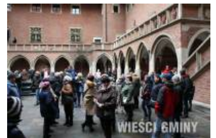
Turyści w Collegium Maius.