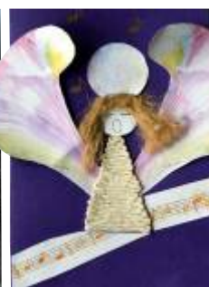
Autor: Paulina Janicka